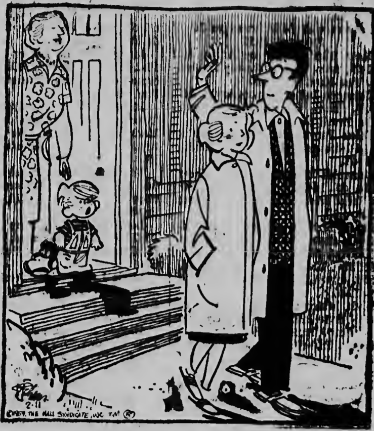
„Rolschaatsen?“ 's Nachts?“